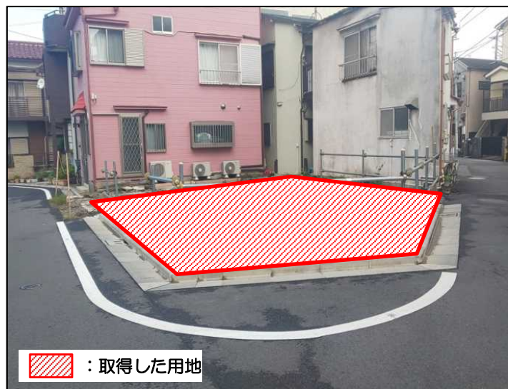
●6.36m道路拡幅及びポケットパーク用地