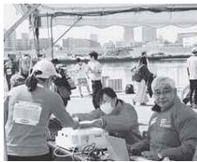
▲活動の様子(かつしかふれあいRUNフェスタ)

東京2020大会においては、約9万人以上のボランティアの活躍が見込まれています。本区では、区民の方々がボランティアとして活動しながら、「支えるスポーツ」の輪を広げていくことを目指しています！