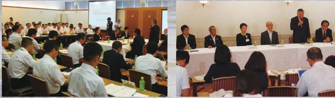
第2回江東5区大規模水害対策協議会