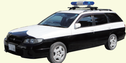
青色回転灯装着車両

【対象】 防犯協会、自治町会、防犯ボランティア団体などで、警察から青色回転灯を装着して自主防犯パトロールを実施することができる証明書を交付された団体 【補助対象経費】 青色防犯パトロール活動に使用した車両の運行に関する経費(活動に要した実走行距離から算出) 【補助金額】 1車両当たり上限30,000円(年額)