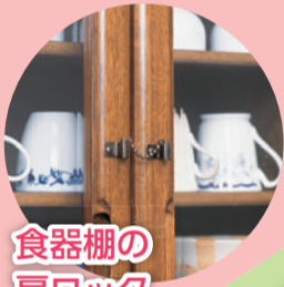
食器棚の 扉ロック