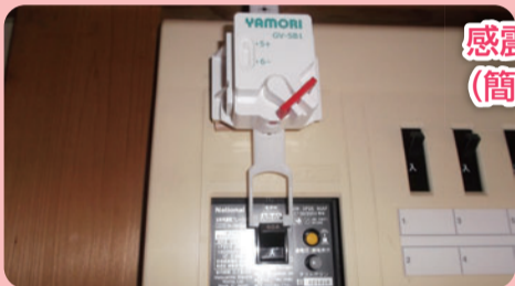
感震ブレーカー (簡易タイプ)