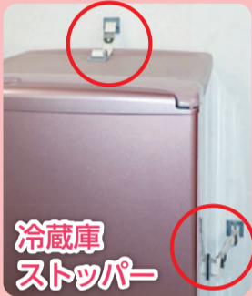
冷蔵庫 ストッパー