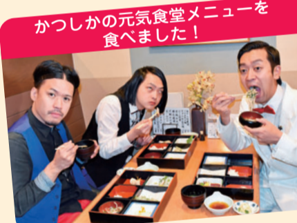
かつしかの元気食堂メニューを食べました!

で、誰も近づいてこなかったです。 ムーディ 怖すぎるな。 伊地知 とここでムーディさん、お腹すいちゃいました。 ムーディ おつ、葛飾でお腹がすいたらこのマークの店がお勧め。かつしかの元気食堂!早速行ってみましょう。