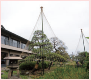
▲雪つりとこも巻き

区内では、堀切菖蒲園堀切2・19・1など、これらの樹木の冬支度が行われています。例年、花菖蒲が咲き誇る堀切菖蒲園では、枝の張ったクロマツ3本に雪つり、クロマツ・フユザクラ・ソメイヨシノ・マキ