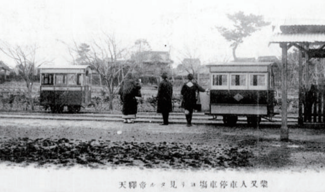
天保帝ヲ見リヨ場車停車人又柴