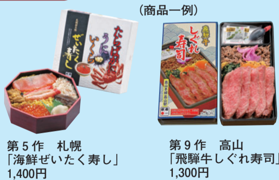
第5作 札幌 「海鮮ぜいたく寿し」 1,400円