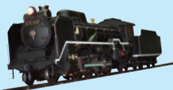
ミニSL乗車コーナー 1回100円 (入館者1回無料)