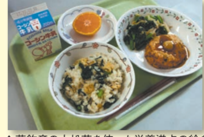
▲葛飾産の小松菜を使った栄養満点の給食

11月7日(金) 午前10時～午後4時15分 11月8日(土) 午前10時～午後4時 【会場】 亀有地区センター(亀有3-26-1イトーヨーカドー駅前店7階) 【担当課】 学務課 ☎5654-8461