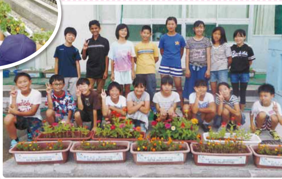
みんなで育てた花を前にしての集合写真 (東綾瀬小学校)

咲いたよ、人権の花 草花を育てることをとおして、命の尊厳を学んで、思いやりの心をはぐくんできます。