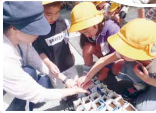
みんなで種植え (金町小学校)