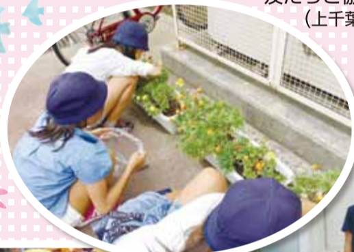
友だちと協力して花のお世話 (上千葉小学校)