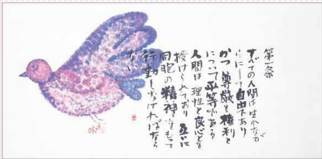
世界人権宣言書画 第1条

世界人権宣言とは、すべての人間が生まれながらに基本的な人権を持っているということを、初めて公式に認めた宣言です。 人権を大切にいくためには、私たち一人ひとりが、お互いの違いや個性を認め合い、相手の気持ちを考え、行動していくことが重要です。この機会に、あらためて人権について考え、そして自分も相手も大切に、笑顔あふれるまちをつくっていきましょう。