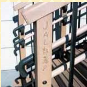
中川右岸公園内階段柱

差別落書きの放置は、新たな差別をうむことにつながります。差別落書きと思われる落書きを発見した場合は、消さずに紙で覆うなどして、区人権推進課(直通 5654-8148)までご連絡ください。