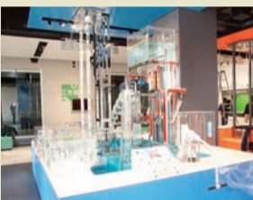
ハンドルを回すと水をくみ上げます