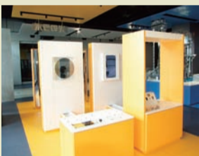
赤外線不思議を体験できます