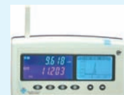
省エネナビ(使用している電力量が目で見分ける)