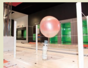
空気力でビーチボールが浮かびます