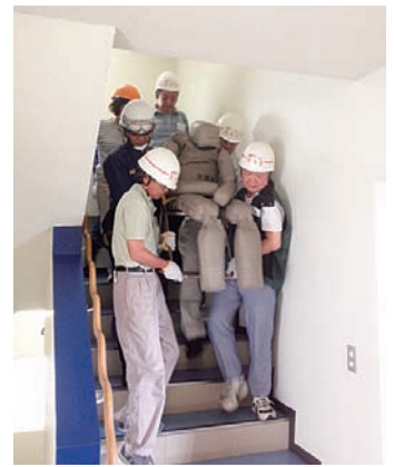
金町マンション自治会防災訓練の様子