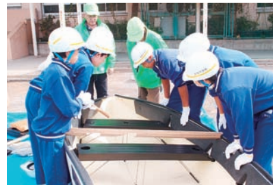
常盤中学校避難所運営訓練の様子