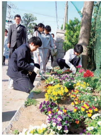
▲上平井中学校での緑化活動の様子