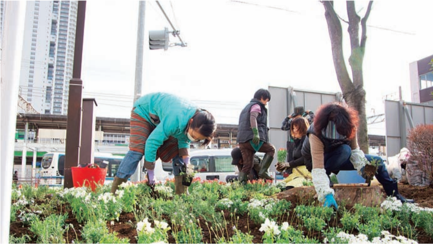
▲金町駅北口周辺では、金町駅北口周辺地区まちづくり協議会、東金町三丁目仲町会、亀が岡町会、公団金町駅前団地自治会、東金町正栄会、東金町中央自治会、東金町一丁目西町会の7団体が交代制で花の手入れを行っています

皆さんの地域でも緑化活動を通して葛飾を花いっぱいのにまにしませんか。【担当課】環境課 ☎5654-8239