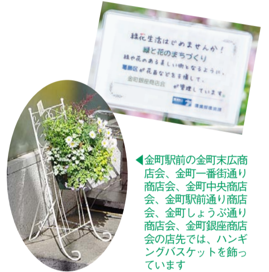
▲金町駅前の金町末広商店会、金町一番街通り商店会、金町中央商店会、金町駅前通り商店会、金町しょうぶ通り商店会、金町銀座商店会の店先では、ハンギングバスケットを飾っています