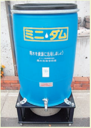
▲写真は200リットルの小型雨水貯水槽です。500リットルを超えるものは大型になります

日7月28日(日)まで 会 中央図書館(立石1・9・1)・上小松図書館(東新小岩3・12・1) 担 中央図書館