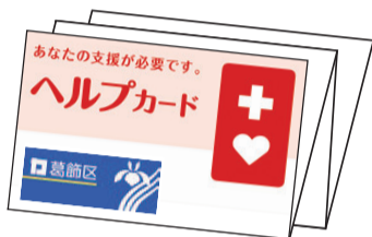
▲カードは運転免許証サイズで蛇腹折りです

避難する際などに、危険を察知していない人や動けない人がいたら、ゆっくり具体的に状況を教えてあげてください。ヘルプカードに緊急連絡先がある場合は、連絡をお願いします。