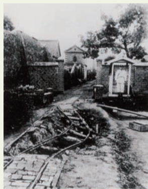
関東大震災で破損した小菅集治監(現東京拘置所)内のレール

亀青小学校、府立第7中学校、富豪の別邸、寺院など14カ所なども開放して避難者の収容にあたる」と記しており、地震の揺れによる被害だけでなく、地震後の火災発生による被害の拡大が関東大震災の災禍を大きくしたことに触れています。また、避難してきた人々への避難誘導や援助などが当時から行われていたことが確認できます。 関東大震災の災禍は、地震による揺れやその後の火災だけではなく、地震の被害で