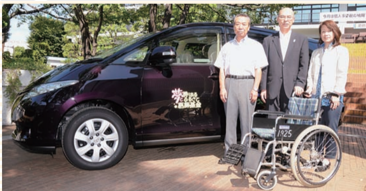
◀ふるさと基金活用第1号となった障害者通所施設「しょうぶエバンズ」の車両