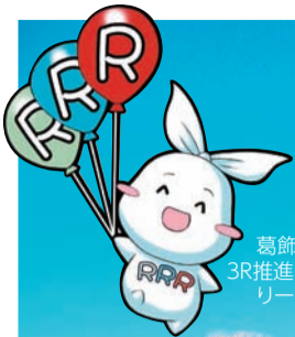
葛飾区ごみ減量・3R推進キャラクターリー(Ree)ちゃん