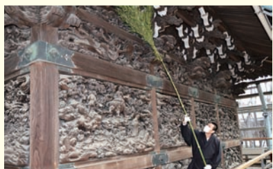
柴又帝釈天題経寺では12月17日にすす払いが行われます

大掃除は、今では年の瀬が迫った頃に行うことが多くなりました。しかし、寺社のなかには13日前後にすす払いの行事を行うところがあります。長い竹の先に笹を結わいた竹箒で諸堂のすすを払う姿は、現代の暮らしの中に残るいにしえの師走の風景として貴重なものです。師走の慌ただしさの中、そんな風景をのぞきながら一年を振り返り、新しい年に思いをはせるのも一興です。