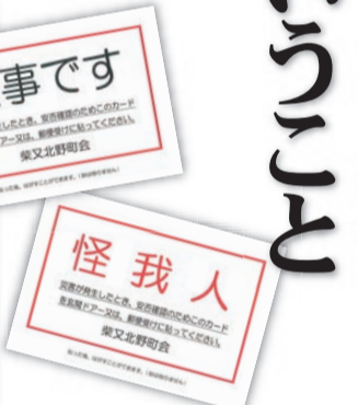
災害時に自宅の扉に貼って安否を知らせるシール