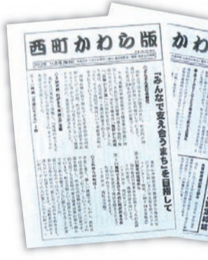
防災情報や地域の話を紹介する「西町かわら版」