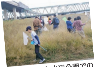
葛飾あらかわ水辺公園での生き物調査

区民参加型の生き物調査イベントの実施や、水元公園など関係機関の自然観察会に協力しています。