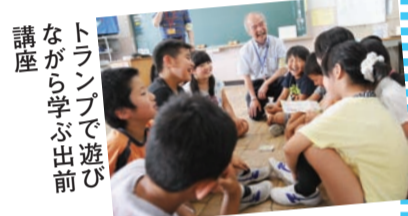
トランプで遊ぶしながら学ぶ出前講座

部会員が小学校で、かつしか生きものトランプを使ったゲームや、生物多様性に関する話などを行い、子どもたちに生物多様性の大切さを学んでもらう「自然環境学習出前講座」などの活動を行っています。