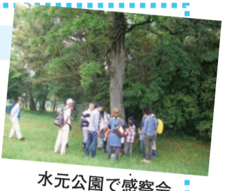
水元公園で感察会

五感を使い、自然に親しむ自然感察会を企画・実施しています。次回は10月に開催予定です。