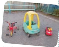
いろいろな乗り物を用意しています!

ランチタイム(正午～午後1時)には、お友達と一緒に持ってきたお弁当を楽しく食べられます。 外庭 乗用玩具やボール、お砂場で遊べます。