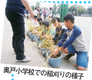
奥戸小学校での稲刈りの様子