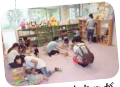
室内にはおもちゃがいっぱい!