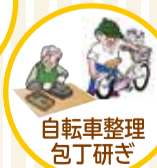
自転車整理 包丁研ぎ