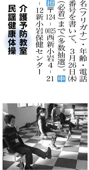
椅子を使って、無理なく続けられるトレーニングです。

日 4月20日(土)8月7日(月)・(金) 5月4日、7月20日(土)を除く。午前10時~11時30分 対 区内在住55歳以上で会場まで自分で来られる方35人 (以前に筋力向上トレーニングを受講した方を除く) 万 往復ハガキに「筋トレ・シニア」・住所・氏名(フリガナ)・年齢・電話番号を書いて、3月26日(木)(必着)まで(多数抽選) 申 担 124-0012立石6-38-11シニア活動支援センター