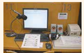
音声対応資料検索機

視覚障害者と、その家族やボランティアが、本を朗読するための部屋を用意しています。