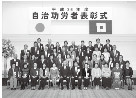
自治功労者 (社会福祉、産業振興功労)