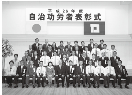
自治功労者 (納税、消防、統計、学校教育功労)