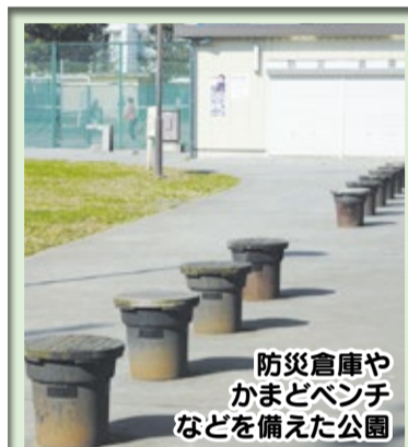
防災倉庫や かまどベンチ などを備えた公園