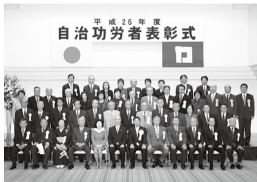
自治功労者 (地域振興、保健衛生、社会教育・体育功労)