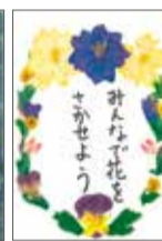
△古山楓さんの作品