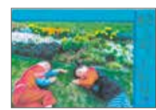
△近藤宏臣さんの作品