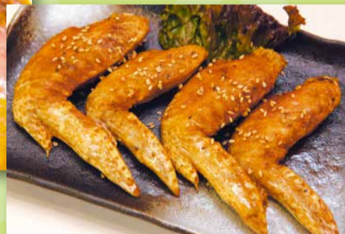
★手羽っ唐★ 鳥益 (新小岩 1-34-6)