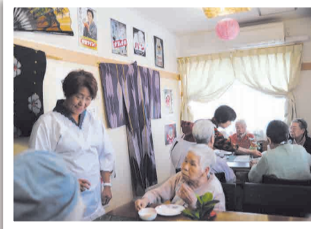
▼スタッフが店員に扮しておもてなししています

利用者の方に楽しんでもらうこと、毎日たくさん笑ってもらうことを一番大切にしています。ご家族の方の後押しや協力もあり、スタッフ側も楽しんでいろいろなアイデアを出し合っています。