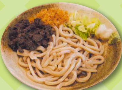
★吉田のうどん(冷)+馬肉★ うどん五葵 (ITSUKI) (西亀有 3-20-14)