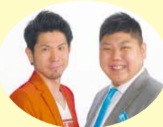
蓮華 (会場リポーター)