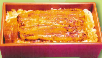
★半うな重★ 鰻 いづみ (青戸 5-2-4)