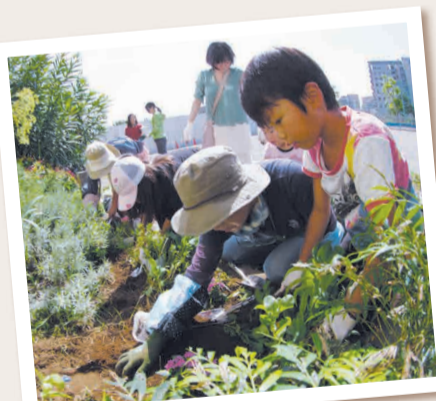
◀活動団体「松南の森プロジェクト」が開催したイベント(松南バル/旧松南小学校)

活動内容の紹介、団体の意見交換・PRなどを行う花いっぱいのもちづくり専用ホームページの開設(平成27年4月運用開始予定)や、区内の花壇を対象に花壇コンテストを実施します。その他、活動を取材する花いっぱいレポートの実施や、花壇講習会など、今後さまざまな事業を計画していきます。