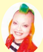
まちゃまちゃ (メインパーソナリティー)

葛飾元気野菜を使ったお弁当のアイデアコンテストや葛飾のご当地焼きそばナンバーワンを決めるイベントを行います。