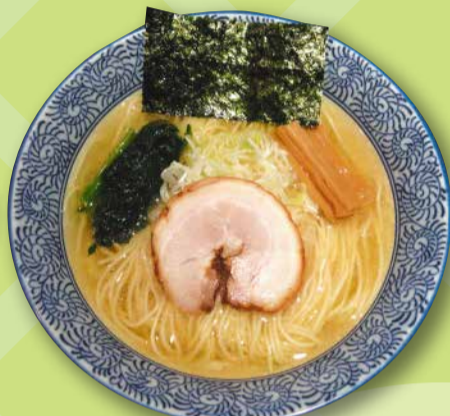
★芳醇塩ラーメン★ 麺屋 一燈 (東新小岩 1-4-17)