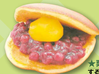
★栗どら焼★ するが (亀有 3-25-1)

「野良スコ」は、葛飾に住む野良猫のスコティッシュフォールド「コタロー」と住民たちの日常を描いたショートアニメーションです。