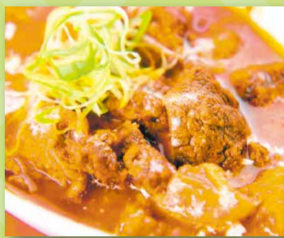
★牛すじ煮込み★ 東立石ホルモン セリん半 (東立石 4-49-7)