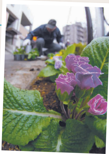
◀柴又植栽事業推進協議会の活動(新柴又駅前)

そこで、団体同士の連携を深め、活動がより活発になるよう、区民や団体、事業者や区が、相互に連携・協働し、パートナーとして活動できる仕組み(協議会)が発足しました。