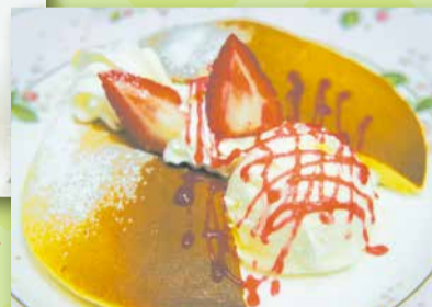
★パンケーキ★ セ・ラ・ヴィ洋菓子店 (堀切 2-57-12)