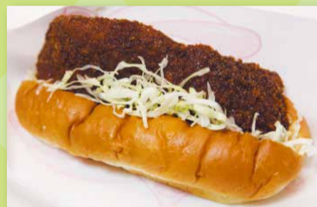
★トンカツドック★ とんかつ 美乃屋 (青戸 7-2-8)