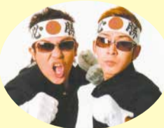
オオカミ少年 (メインパーソナリティー)