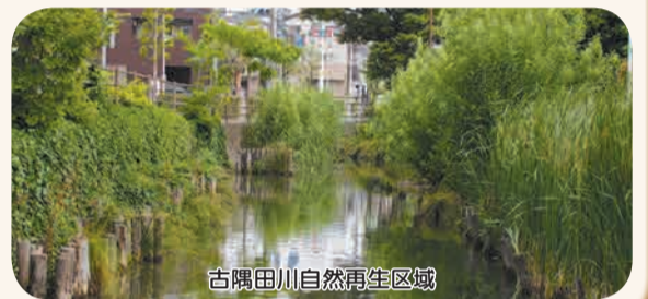
古隅田川自然再生区域

江戸川や荒川などの 河川、古隅田川などの 水路、水元小合溜など の池沼には、樹林や草 地が残り、葛飾ならで はの景観をつくり出し ています。