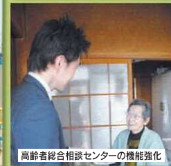
高齢者総合相談センターの機能強化