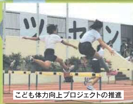
こども体力向上プロジェクトの推進