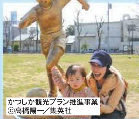
かつしか観光プラン推進事業