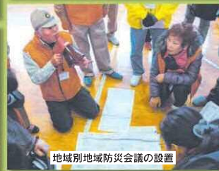
地域別地域防災会議の設置