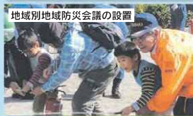
地域別地域防災会議の設置