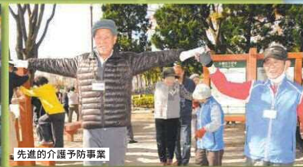
先進的介護予防事業