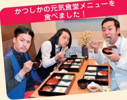
かつしかの元気食堂メニューを食べました!

で、誰も近づいてこなかったです。 ムーディ 怖すぎるな。 伊地知 とところでムーディさん、お腹すいちやいました。 ムーディ おつ、葛飾でお腹がすいたらこのマークの店がお勧め。かつしかの元気食堂!早速行ってみましょう。