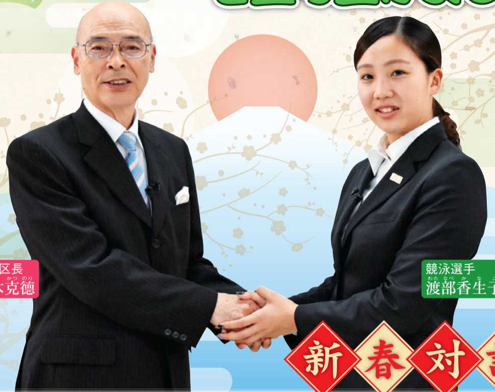
葛飾区長 青木克徳