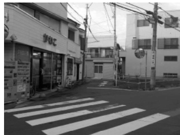
主要生活道路（東四つ木三丁目）

東四つ木三丁目では、水道路から堤防道路につながる一部区間と、水道路から木根川中央公園につながる一部区間の拡幅整備（幅員6m）を行い、水道路の交差点には横断待ちのスペースを整備する予定です。