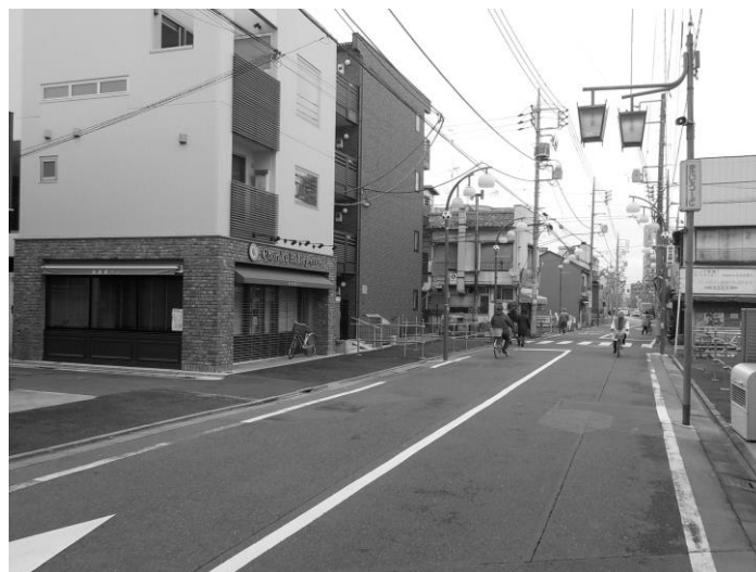
四つ木2-7街区の用地買収状況