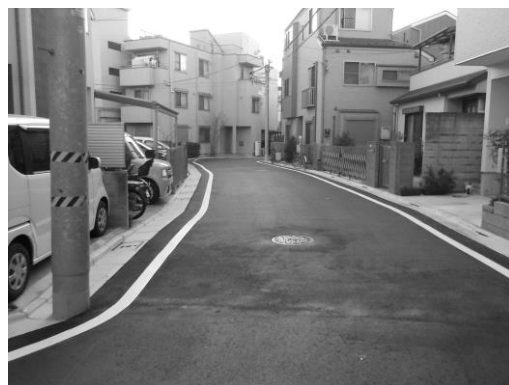
主要生活道路（四つ木一丁目）

四つ木一丁目では、四つ木つばさ公園から旧西渋谷小学校につながる一部区間と、四つ木公園からバス通りにつながる一部区間を幅員6mに拡幅整備しました。