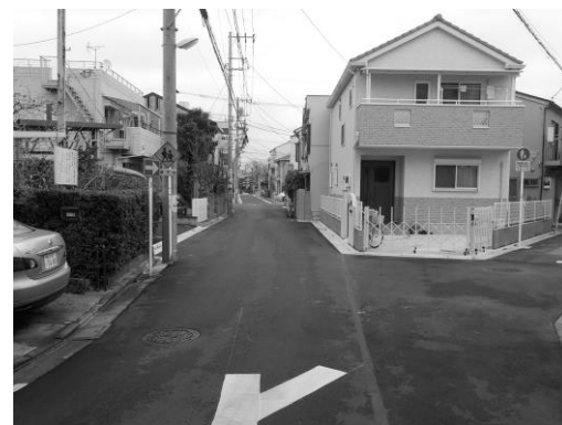
主要生活道路（東四つ木四丁目）

東四つ木三・四丁目では、水道路から堤防道路につながる一部区間と、渋谷商店街から東四つ木諏訪児童遊園につながる一部区間を幅員6mに拡幅整備しました。