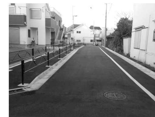
南側出入口の接続道路

しぶえ南児童遊園内を約30m拡張し、南側出入口には延長約35mの接続道路を整備しました。