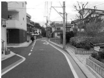
主要生活道路（東四つ木三丁目）

東四つ木三丁目では、水道路から木根川中央公園につながる道路の一部区間の拡幅整備（幅員6m）を行いました。