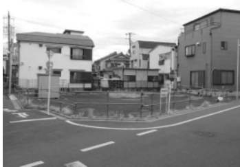
みなみ広場予定地

東四つ木四丁目には、かまどベンチや防災パーゴラなどを設置した面積約 284 m 2 の広場を整備する予定です。