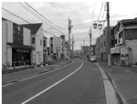
四つ木1-3-3街区付近の用地取得状況