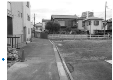
主要生活道路（四つ木二丁目）

葛飾区では、関係権利者の皆様のご意向を踏まえ、公園と新設道路を新たに計画し、整備を進めています。