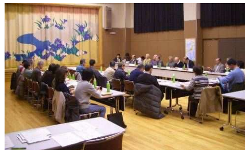
構想の完成を最終確認した、今年度最後の検討協議会・勉強会（合同会議）の様子（3/15）

この構想に基づくまちづくりを、これから葛飾区と協力して進めていくために、4月初旬に、葛飾区長へ提案する予定です。