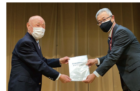
当協議会会長(左)から葛飾区都市整備部長(右)へ提出

提出された「堀切菖蒲園駅周辺まちづくり構想」をもとに、今後は区とまちづくり推進協議会で協働し、駅周辺のまちづくりの実現に取り組みます。