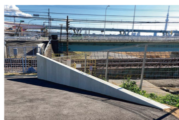
線路脇に設置されたパラペット (2/21 当協議会が撮影)