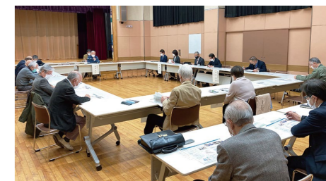
全体会の様子(区職員も含め26名が参加)