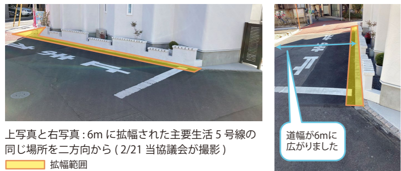
上写真と右写真：6mに拡幅された主要生活5号線の同じ場所を二方向から(2/21 当協議会が撮影) 拡幅範囲

幅員6mへの拡幅路線のうち、主要生活道路5号線は、現在6mへの拡幅整備が進んでいます(下写真参照)。主要生活道路1号線・3号線は、拡幅整備にむけて用地測量の準備を進めており、令和5年度4月頃には、主要生活道路1号線沿線の権利者に向けた事業説明会を予定しています。また、主要生活道路4号線は、無電柱化に向けて引き続き検討調査を進めています。