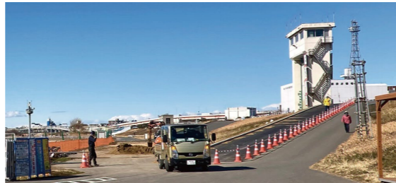
工事車両搬入のために拡幅された坂路