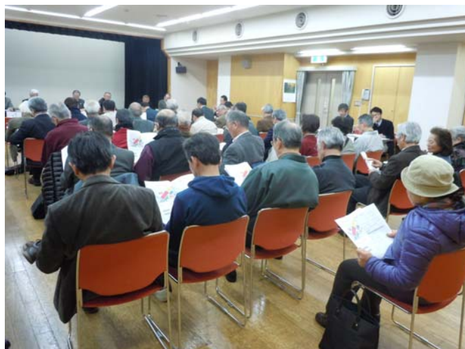
【新小岩地域まちづくり連絡会議（新小岩地区センター）】

また、全体会で報告した 5 地区の勉強会、検討会での街づくり計画検討状況や、南北自由通路整備、南口駅前広場整備計画について、多くの方々にご紹介するために、3 月 22 日と 23 日に「新小岩駅周辺地区まちづくりパネル展示」を開催しました。