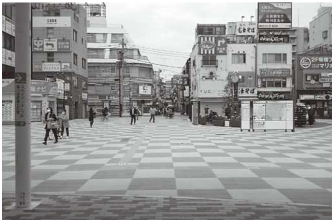
完成した北口駅前広場の様子

昨年度から進めていた新小岩駅南北駅前広場の改修工事について、北口駅前広場整備工事は令和 2 年 9 月 17 日に、南口駅前広場バリアフリー改修工事は 12 月 1 日に、それぞれ完成しました。