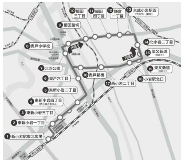
【細田循環バス 運行経路図】