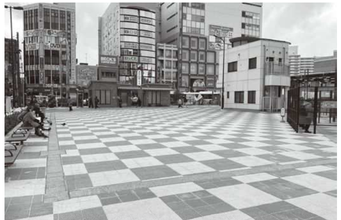
生まれ変わった南口駅前広場島地内の様子