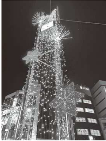
【南地域のイルミネーションの様子】

南地域では、新小岩駅南口駅前広場島地内、各商店街街路灯52本に華やかなイルミネーションで街を彩りました。