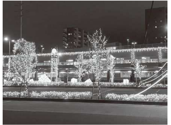
【北地域のイルミネーションの様子】

北地域では、新小岩駅北口駅前広場周辺、新小岩駅東北広場（自転車駐車場含む）、スカイデッキつつみに、約26万球の煌びやかな光に包まれる圧巻のイルミネーションで街を彩りました。（点灯期間：令和2年12月4日（金）～令和3年2月14日（日））