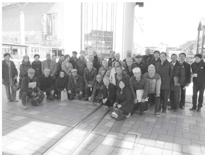
【海老名市職員の方との集合写真】

2月14日(水)に、新小岩北・南地域まちづくり協議会合同のバス見学会を実施しました(計32名が参加)。