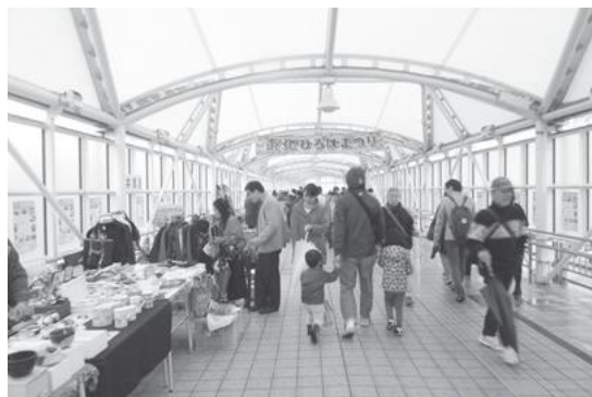
【にぎわいのあるフリーマーケット】