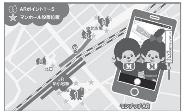
【モンチッチARの利用可能エリア】 ©Sekiguchi

さらに、平成30年3月には、スカイデッキたつみの壁・床・天井(夜間のライトアップ)やエスカレーター手すりまで、モンチッチくん、モンチッチちゃんが新登場。新小岩に初めて来られた方や、普段から利用している方などに、いろいろな表情でお出迎えし、まちに彩りを添えています。