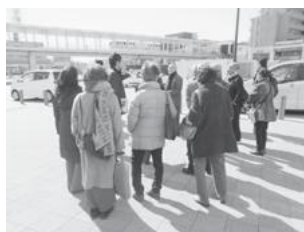
【西口中心広場の様子】

海老名駅周辺地区では、担当者から自由通路完成までの説明を受け、実際に自由通路・駅周辺商業施設を見学することで、まちの賑わいを実感しました。