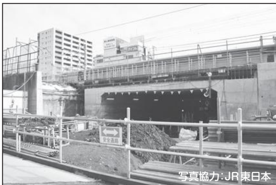
① 貨物線下 ボックスカルバート