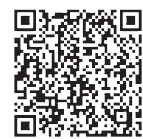
【葛飾区総合アプリ】

産業観光部観光課(モンチッチ) ☎03-3838-5558 政策経営部情報政策課企画係(AR) ☎03-3695-1111(内2026)