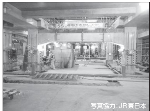
② 快速線下 高架橋

最新の工事状況は、葛飾区公式サイト内に掲載しています！ インターネット上で『新小岩駅南北自由通路』と検索してください。