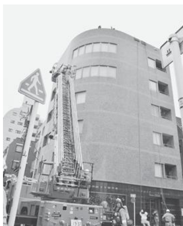
【本田消防署による消防訓練】