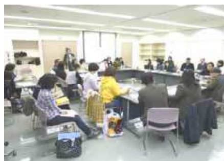
各団体の改善案を発表しました。

4回目は、取組団体同士による意見交換を行いました。ワークショップが終わり、どうして危険なのか、どうしたら安全になるかみなで考えた改善策の発表をしました。パトロールの強化をする、樹木の剪定により見通しをよくする、子どもたちと公園のペイントをしてきれいな公園にするなどの改善案が発