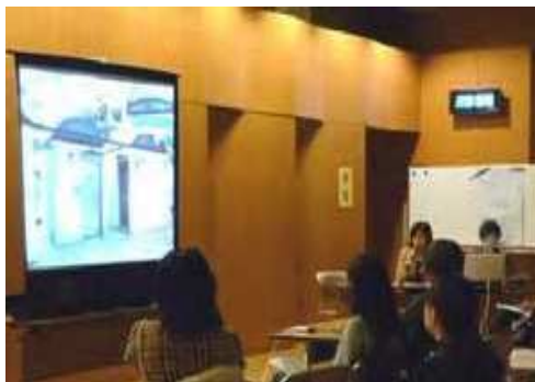
報告会での発表の様子

子どもに飛び出し注意を促すために道路に止まれのマークを設置してもらいました。また、公園のペイントを現在亀有警察、公園管理所協力のもと計画をすすめています。