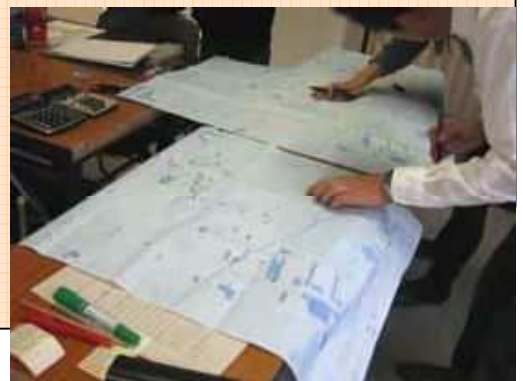
危険箇所が分かる地図を作成しています。

教育委員会事務局生涯学習課 区民大学担当係 「子どもを犯罪から守る」まちづくり活動支援事業 担当 土川・佐藤 TEL 5654-8475 (直通)