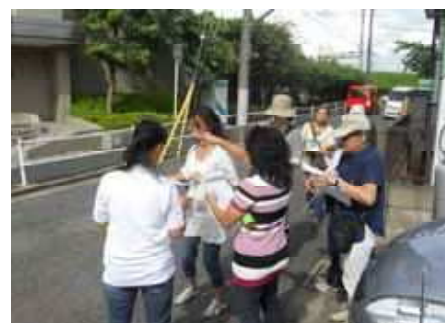
危険箇所の点検中