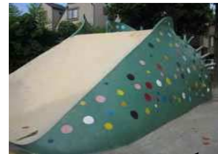
ペイントされた松南公園

★今年 3 回目のアンケートを実施。活動を続けて 7 年目。自転車事故防止や高齢者のため商店街の通路の真ん中にベンチの設置、公園の外灯の増設など様々な活動を続け犯罪件数が大幅に減っています。