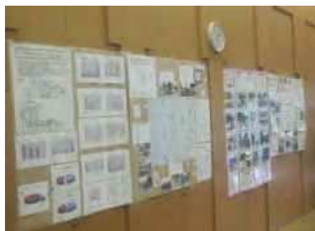
宝木塚小学校PTAの取組紹介ポスター

奥戸小学校PTAの活動報告では、危険箇所の改善前と改善後を分かりやすく説明されていました。（2面に関連記事）