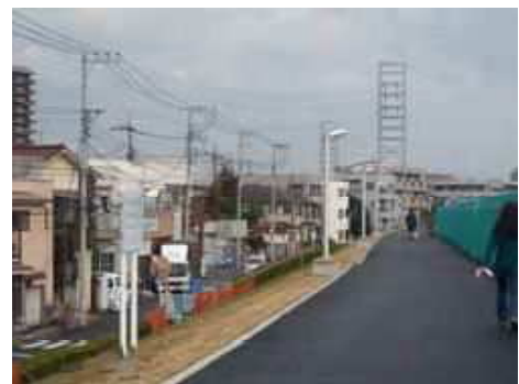
改善後(街灯、ベンチが設置され、道幅も広くなった土手)