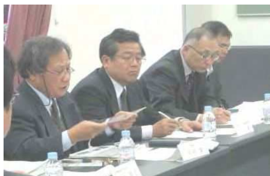
関係行政機関との懇談会（11月20日）

行政の職員がどんな仕事をしているのか、この案件はどこに問い合わせればいいのか、PTAや地域の方だけでは解決できないことを質問したりして話し合いをすすめました。「子どもを犯罪から守る」まちづくり活動は、行政とパートナーシップとなり活動をすすめていくことが重要となります。そのために今回のような懇談をすることにより、今後の活動が円滑にすすんでいくのではないのでしょうか。