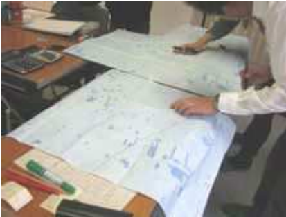
犯罪危険地図作成の様子

11月27日に中青戸小学校PTAの方がアンケート集計を行いました。11月にアンケートを子どもたちに配布をし、取り組みを開始しました。アンケートの回収率は約85%で犯罪被害箇所はやはり大きい公園の青戸平和公園に集中していたようです。集中して作業に取り組んだため、予定より早く作業は終了しました。