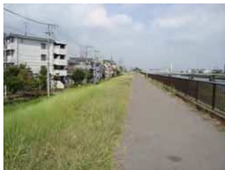
改善前(新中川土手)

奥戸小学校は、「奥戸まちかど防犯隊」という名称でフィールドワークを実施しています。