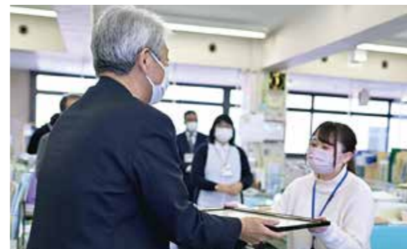
「note」を始めたら、優良賞に選ばれた! https://katsushika-city.note.jp/n/n75e017b46176

葛飾区では、区民サービス向上や仕事の簡素化・効率化、組織の活性化を目的とし、毎年、各職場で行われている業務改善の取組を全庁で共有しています。