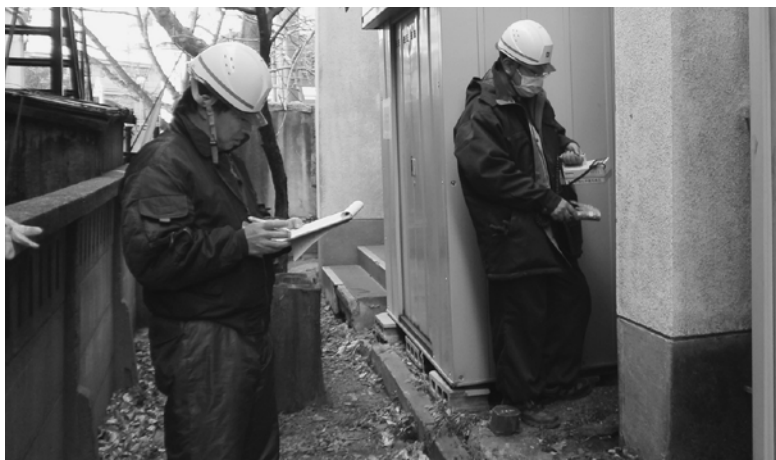
放射線量測定のようす