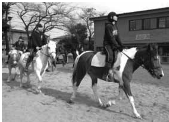
ポニースクールでの教室の様子

幼児を対象とした引き馬も行っています。皆さんもぜひ、「ポニースクールかつしか」に遊びに来てみませんか。