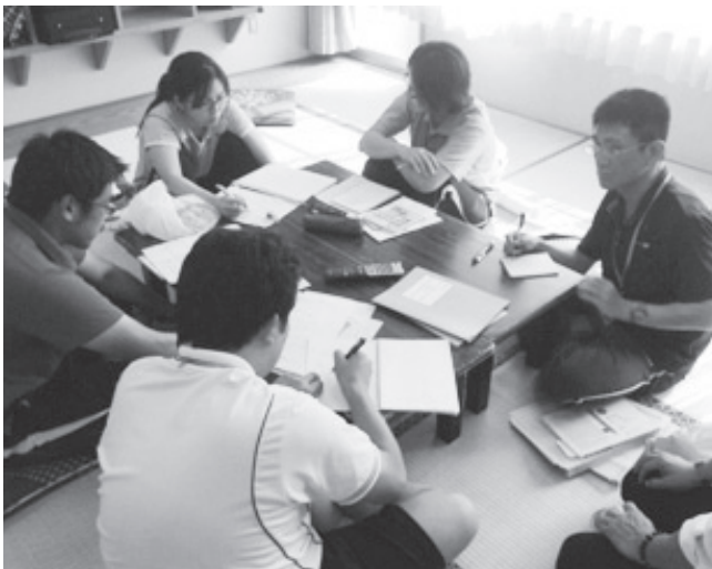
互いの授業実践における課題について語り合う教員（若手教師塾の夏期集中研修：日光林間学園にて）

今年の夏には葛飾区日光林間学園で1泊2日の夏期集中研修を実施しました。宿泊研修では、教員同士が相互交流を図り、研究内容を充実させるとともに、大いに教育について語り合うことができました。