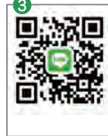
③上のQRコードを読み取る