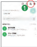
①LINEを起動しホーム画面 右上の🔍アイコンを押す