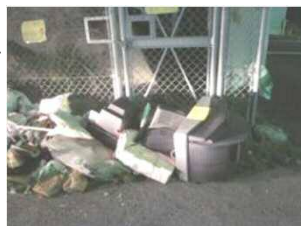
▲不法投棄現場写真

環境省では、毎年5月30日から6月5日までの期間を「全国ごみ不法投棄監視ウィーク」として、不法投棄撲滅のための監視や啓発活動などの全国一斉実施を呼びかけています。