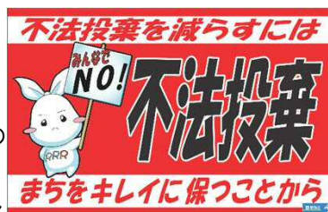
▲不法投棄撲滅PR用マグネット