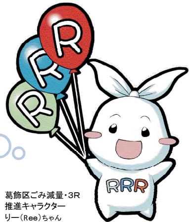
葛飾区ごみ減量・3R 推進キャラクター リー(Ree)ちゃん