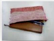
【作品例・小物入れ】

古くなったシーツや、ハンカチなど裂くことができる 生地を裂いて、織り機で1枚の布を織ります。