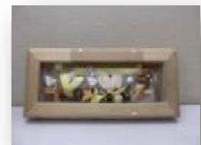
【作品例・ クリスマス立体額】