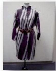
【作品例 着物からワンピース】