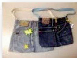
【作品例・ジーンズリメイク】

紙パックを使ったふた付の小物入れや、はけなくなった ジーンズを再生利用してトートバッグなどを作ります。