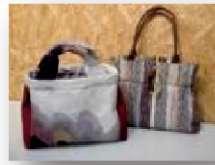
【作品例・帯からバッグ】