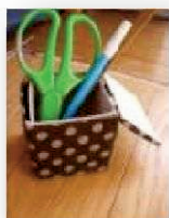
【作品例 ふた付小物入れ】