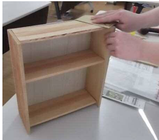
⑦ペンキの色を入りやすくするため、やすりがけをする