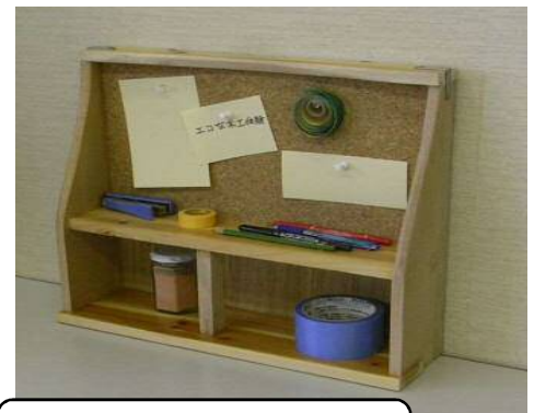
卓上インテリアラック