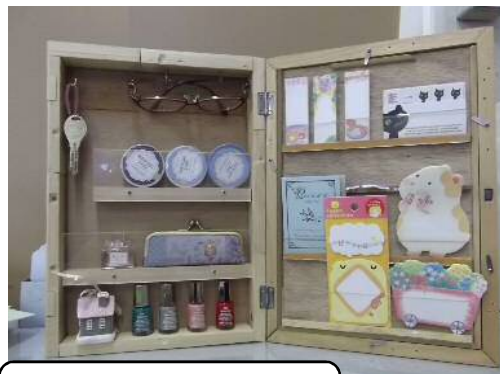
壁掛け収納ケース